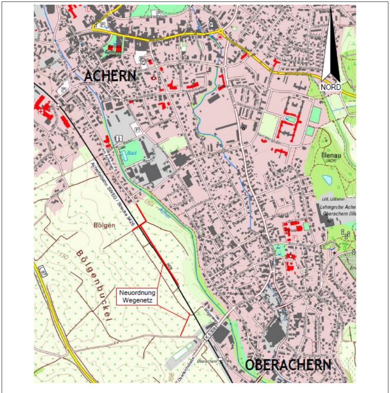
Abb. 1: Übersichtsplan